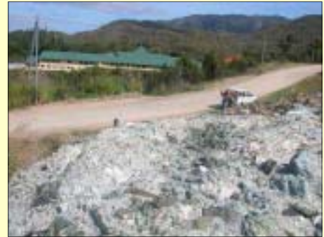
Les travaux du collège de Ouégoa ont généré des remblais contenant du matériau amiantifère, source émettrice de fibres dans l'air

En 2004, le débat social est relancé par André Fabre, président de l'Adeva-NC, l'Association de défense des victimes de l'amiante qui accuse notamment la serpentine, roche susceptible d'héberger des minéraux amian-