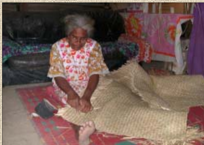
Le mode de vie en milieu tribal et l'habitat favorisent le risque d'exposition aux poussières d'amiante. A l'intérieur, peu de meubles. On s'assoit le plus souvent à même le sol, sur une natte. Les femmes, s'occupent des activités domestiques