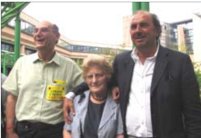
Un combat mené depuis trois décennies.

C'est la première fois aujourd'hui que sont engagées des poursuites pénales mettant en cause les dirigeants d'une multinationale responsable de la mort d'ouvriers et de la contamination d'une région. C'est un exemple à suivre.