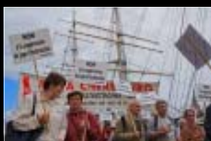
DUNKERQUE 20 juin 2009

LA SOLIDARITÉ EUROPÉENNE DES VICTIMES DE L'AMIANTE EST EN MARCHÉ !