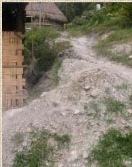
Une partie des habitations de la tribu de Tendo est construite sur des schistes amiantifères (trémolite). Un chemin souvent utilisé par les habitants traverse cette zone

Les habitations se composent de plusieurs constructions, construites de « bric et de broc » : maisons en bois, cases en matériaux naturels (torchis et paille), bâtiments en aggloméré, ciment