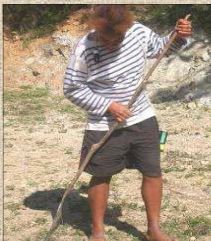
Le nettoyage des sols en extérieur près de roches amiantifères peut être à l'origine d'une exposition courte mais intense aux fibres