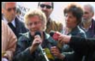
TURIN 6 avril 2009