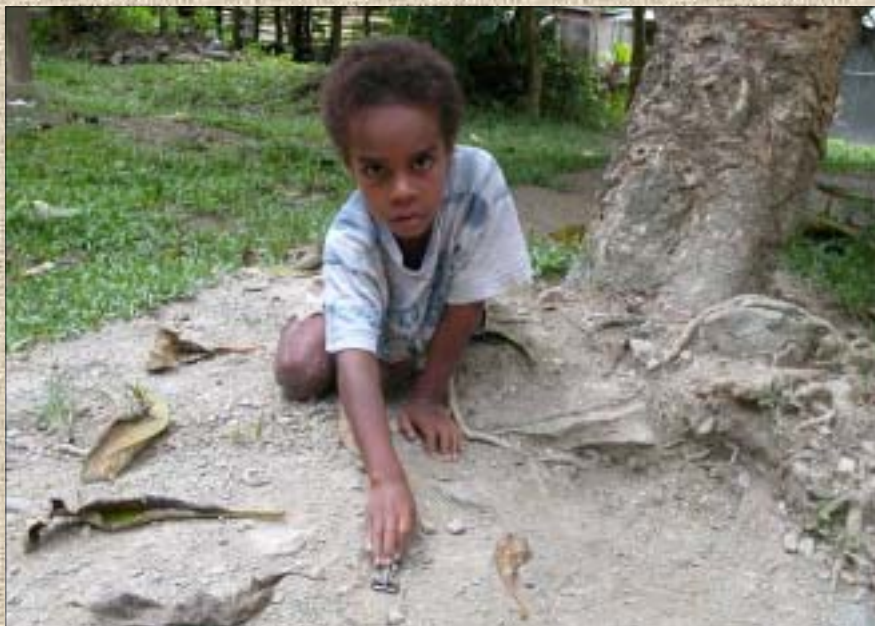
A la tribu de Tendo, l'affleurement se situe dans l'espace de vie de la famille V. Les enfants jouent dans la terre contenant de l'amiante trémolite

Le mode de vie tournée vers l'extérieur favorise le contact avec les poussières contenant de l'amiant. Dans ces espaces contaminés, l'habitat nous l'avons vu, n'offre peu ou pas de protection contre les fibres. Celles-ci s'accumulent dans les maisons où elles sont remises en suspension par le seul déplacement des individus. Les Mélanésiens de la tribu de Tendo sont ainsi exposés lorsqu'ils vaquent à leurs activités quotidiennes. L'exposition est passive et permanente, longue dans le temps, régulière, débutant dès le plus jeune âge. Elle se conjugue à une exposition plus importante lorsque les activités familiales telles que le balayage, le jardinage remettent les fibres en suspen-