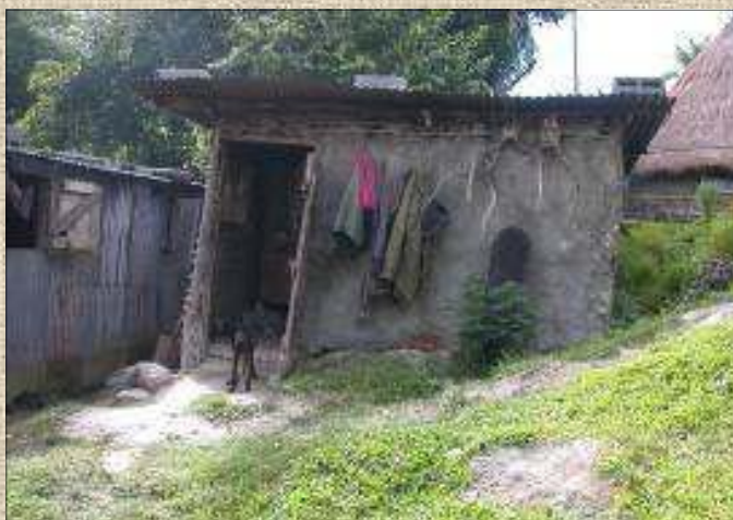
Les habitations sont construites « de bric et de broc ». Pas de vitres aux fenêtres, des portes qui restent souvent ouvertes, laissant passer la lumière, mais aussi des poussières d'amiante venant de l'extérieur qui polluent l'air de la maison.

Même profondément transformée par l'influence occidentale, la vie en tribu se décline au rythme de la coutume, cet ensemble de règles non écrites, d'usages et d'habitudes vécues au quotidien par les Mélanésiens.