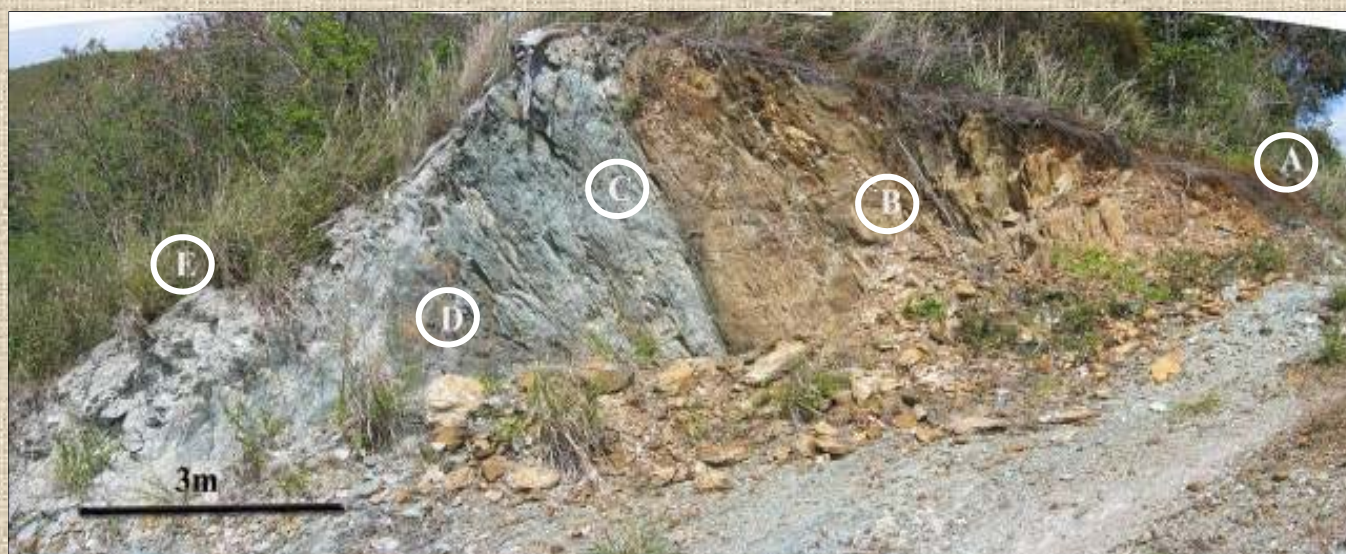
A-C-D-E : horizons de talc-schiste contenant de nombreuses fibres d'amiante (trémolite) B : horizon de schistes argileux - tribu de Ouare - Hienghène (Travaux et photographie de Christian Picard, géologue, professeur des Universités, 2006)

La géologie de la Grande-Terre calédonienne est comparable à celle de la Corse du Nord, de la Grèce, de la Turquie, de Chypre.