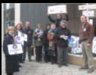
BRUXELLES 19 février 2009