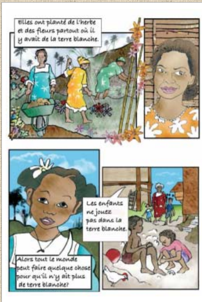
La bande dessinée est pensée afin que les lecteurs de la vallée s'identifient et se reconnaissent dans les lieux et les situations (Document Anne-Marie Wilmart, Sabrina Belgaid et auteur)

L'inhalation des fibres se fait de façon imperceptible, sans manifestations douloureuses ou visibles. Et les maladies dues à cette inhalation se