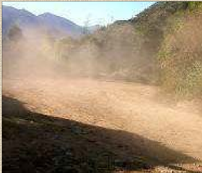
Sur les pistes, le vent et le passage des véhicules soulèvent des nuages de poussières chargées d'amiante

M-A. H. La Nouvelle-Calédonie est un pays d'outre-mer (POM). Le congrès de Nouvelle-Calédonie doit voter ses propres lois. Il y a un décalage flagrant entre la métropole et la Nouvelle-Calédonie : l'amiante a été interdit en métropole en 1997. En Nouvelle-