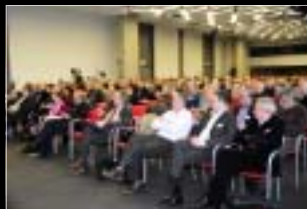
STRASBOURG 16 décembre 2008