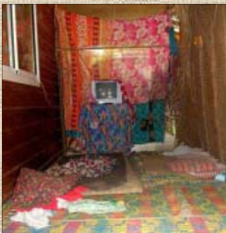
Le sol est couvert de fibres d'amiant (trémolite). Il est le lieu de nombreuses activités : regarder la télévision, papoter, faire des devoirs...

Ce constat est alarmant si on évalue la surface de l'habitacle potentiellement contaminée. Le conducteur et les enfants qui se rendent régulièrement à l'école respirent à chaque voyage des fibres mortelles.