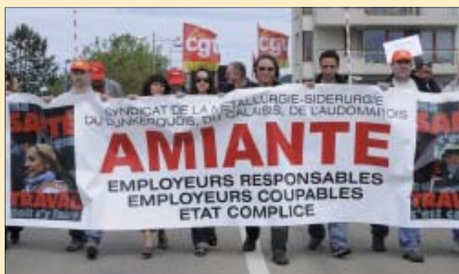
Dans la manifestation de Dunkerque, la CFDT des mineurs de Lorraine et le syndicat CGT de la métallurgie-sidérurgie de la région.